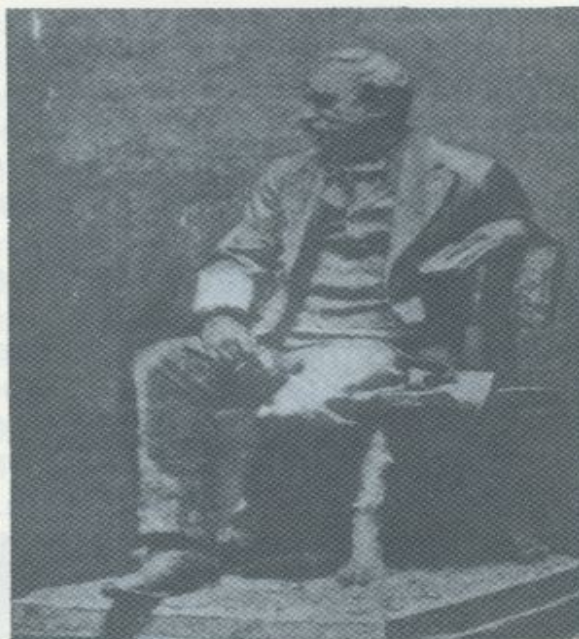
Estatua de Antonio de Trueba, por Mariano Benlliure