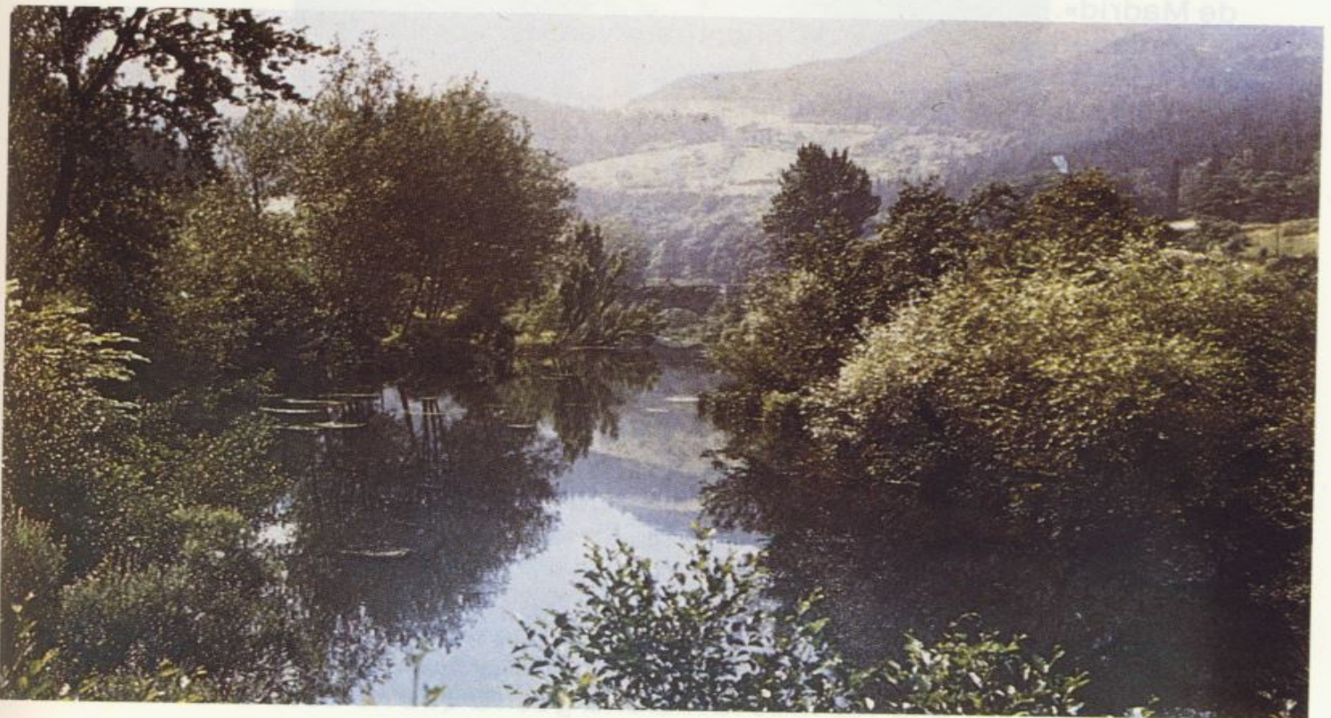
Las Encartaciones, comarca en la que nació y vivió su niñez «Antón el de los Cantares».

Una tarde, en que la hermosura del cielo armonizaba con la que ofrecía el vallecito de Luche (hoy Aluche), en la Casa de Campo, escribió: