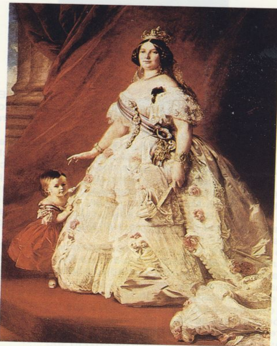
Isabel II, bajo cuyo reinado se creó la Guardia Civil y a la que Antonio de Trueba dedica unos versos en su romance.

Ya en la capital vizcaína nuestro Antón el de los cantares , como era conocido por la popularidad que alcanzaron sus obras, costumbristas y moralizantes, colabora en «El Noticiero Bilbaíno», especialmente en sus «Hojas Literarias»; en la «Revista Euskera», de Pamplona; en «La Ilustra-