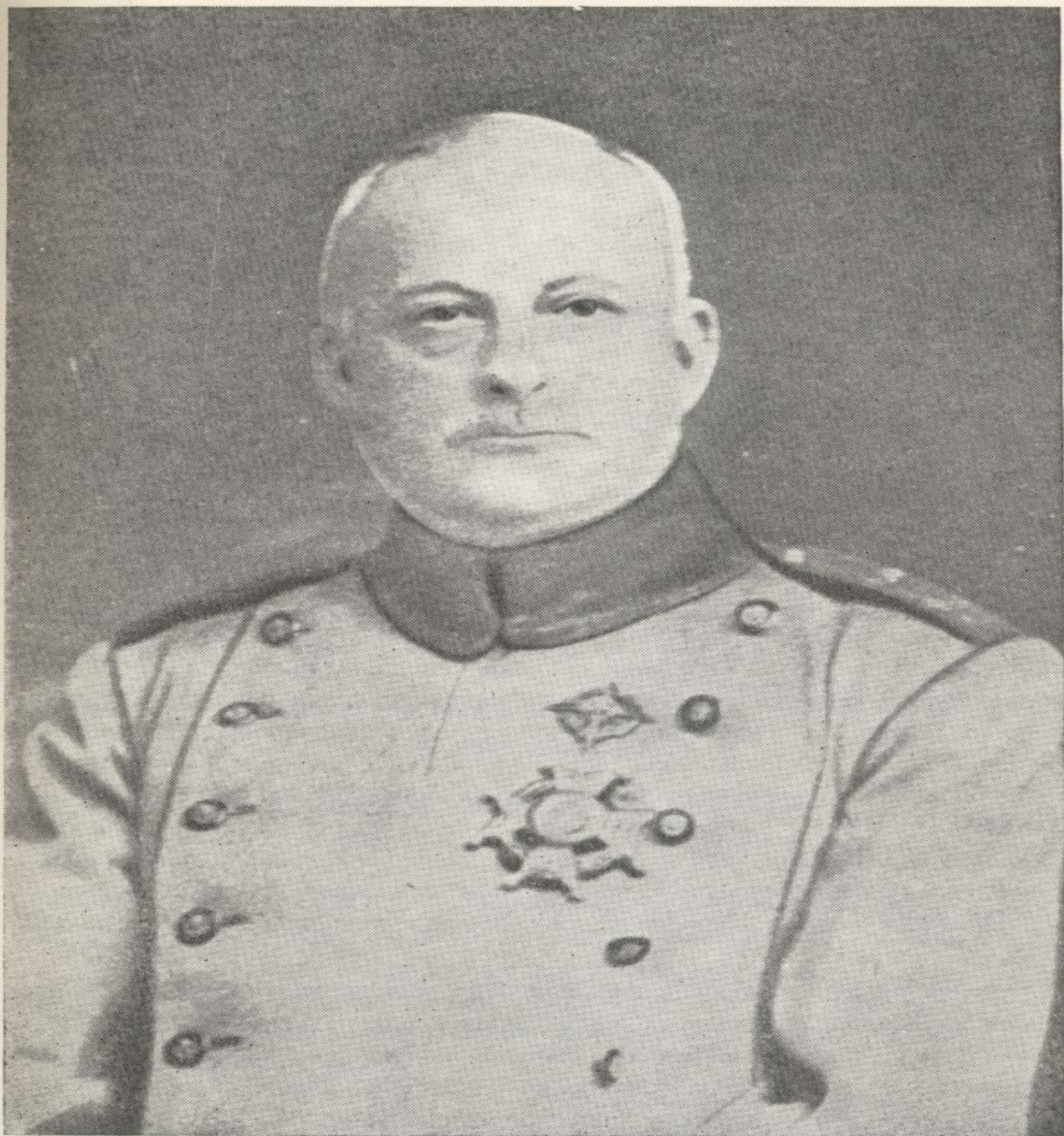
El General don Miguel Primo de Rivera y Orbaneja, marqués de Estella