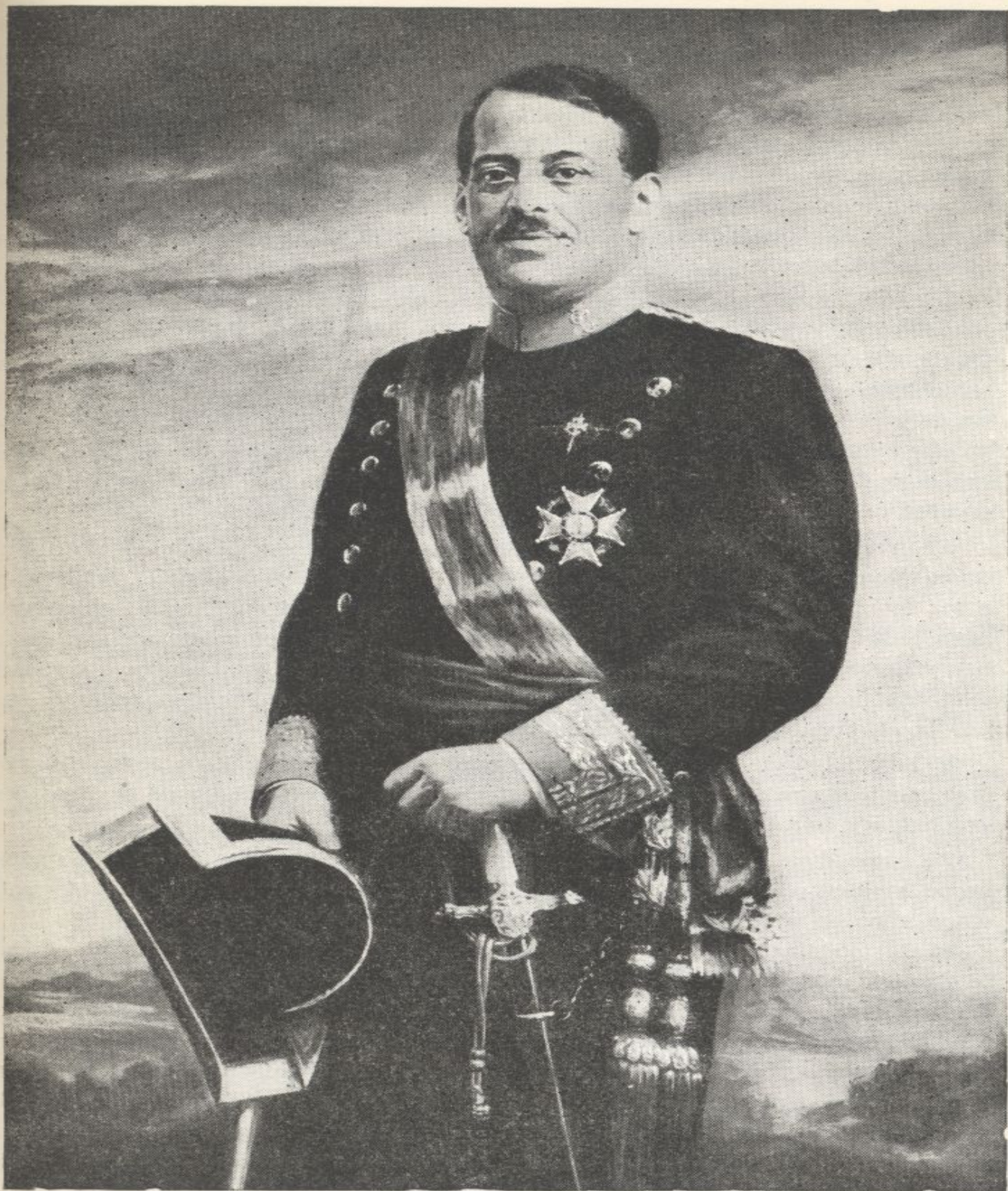
Don José Sanjurjo, Director General de la Guardia Civil (3-XI-1928 a 3-II-1932).