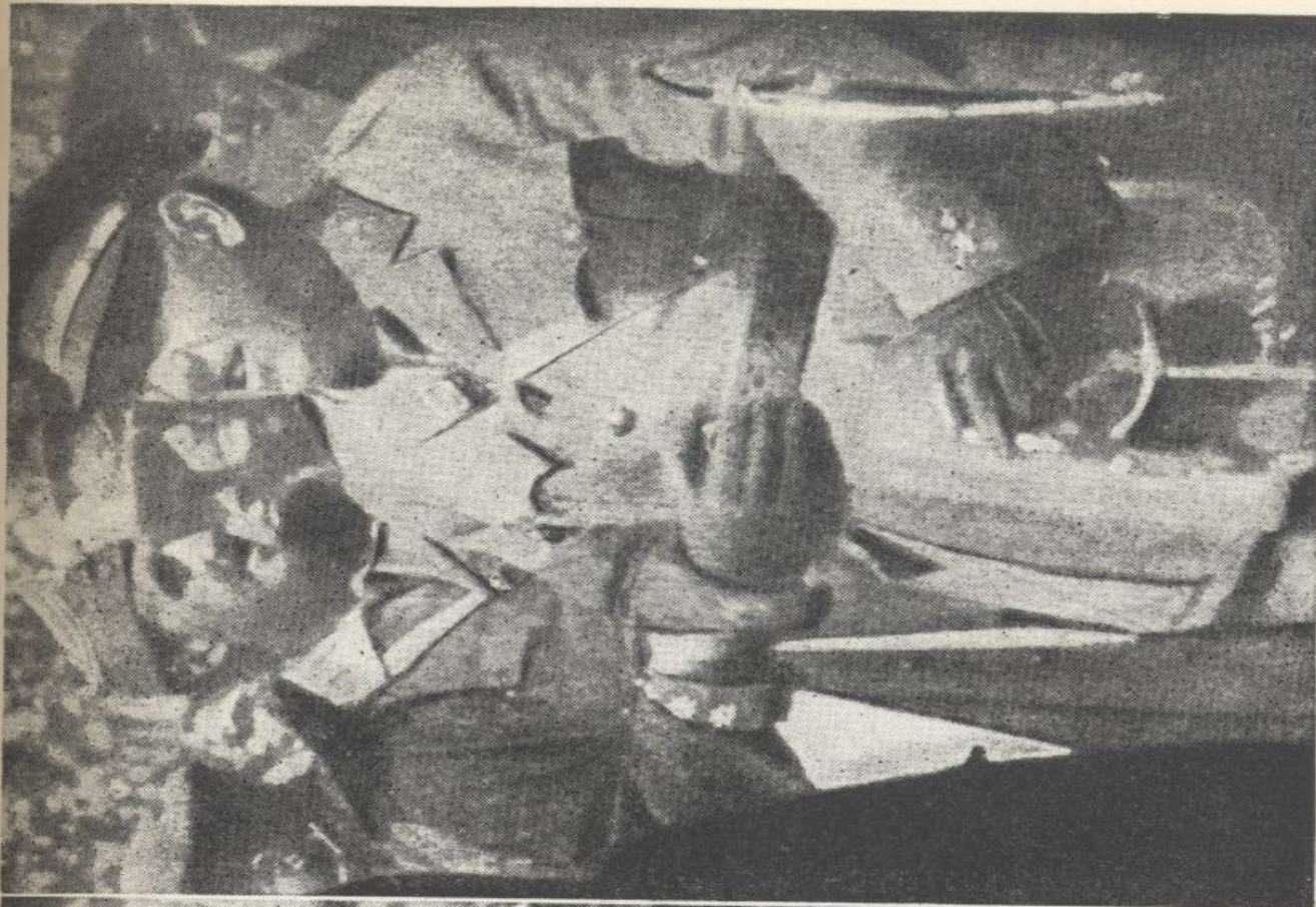
Sanjurjo, con el entonces Coronel Franco, en el desembarco de Alhucemas