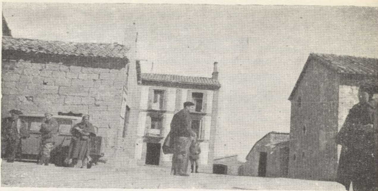
El autor, días después de la sublevación y en el lugar en que esta se produjo

un Gobernador tratase de imponer su autoridad, ni siquiera sobre una autoridad subordinada.