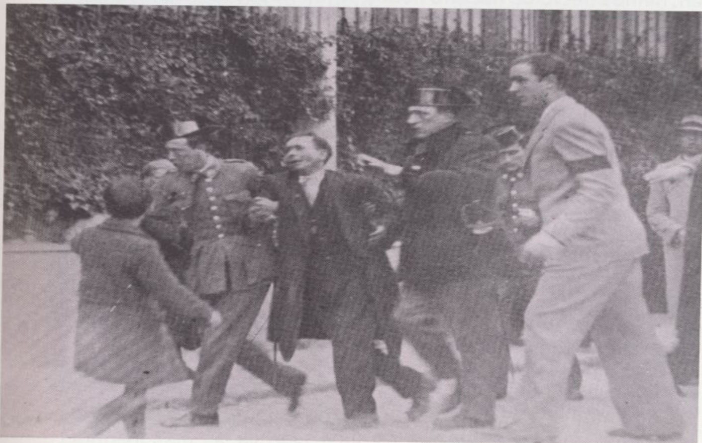
Evacuación de uno de los heridos en el tiroteo habido durante el desfile militar.