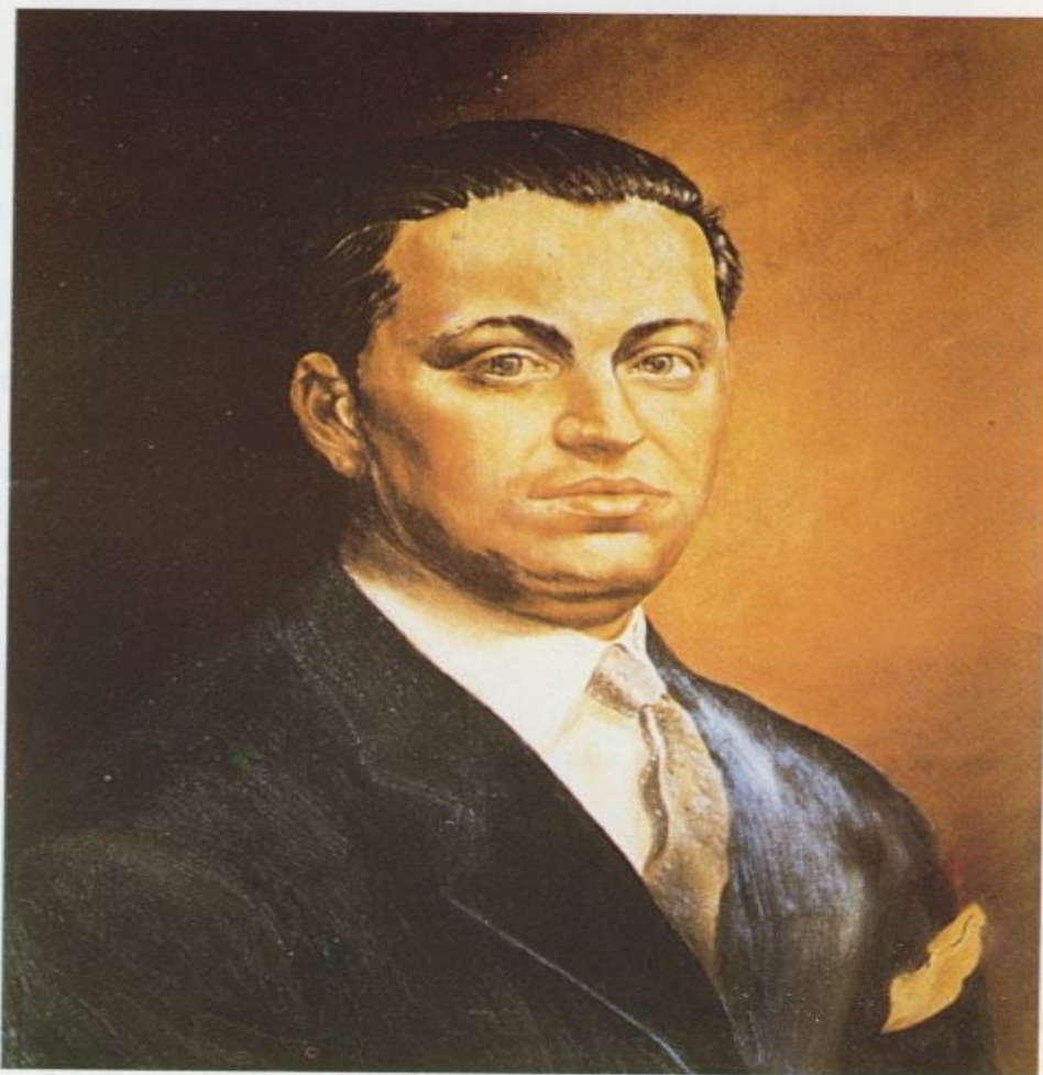
Don José Calvo Sotelo, insigne orador y polemista incansable en las Cortes de la II República.