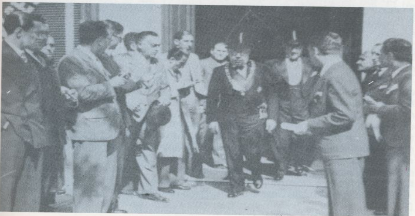
Don Manuel Azaña, máximo protagonista político durante cinco álgidos años, fue nombrado en mayo de 1936 Presidente de la II República.

Al terminar Calvo Sotelo, sube a la tribuna de oradores el catalán Ventosa. Pero la tarde no se muestra propicia para extensos discursos. Hay prisas y nervios. Pesa sobre el ambiente lo sucedido durante el entierro del Alférez de los Reyes. El palacio del Congreso sigue rodeado de guardias de Asalto. Se habla y se exagera en cuanto al número de muertos y heridos. Ventosa se limita a decir: "Solo con asistir a este debate, solo con escuchar las manifestaciones de ayer y hoy —insultos reiterados, incitaciones al atentado personal, invocaciones a aquella forma bárbara y primitiva de justicia que se llama ley del Talión, petición inólita y absurda del desarme de derecha, y no de todos—, solo con presenciar y observar el espíritu de persecución y opresión que se manifies-