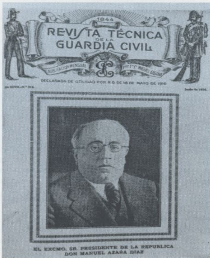
Don Manuel Azaña en la portada de la Revista Técnica de la Guardia Civil al ser nombrado Presidente de la República.

Durante toda la República, a pesar del gran número de víctimas del Cuerpo, solo se había dado un caso de entierro de amplia divulgación, el del cabo y tres guardias asesinados en Castilblanco en el último día del