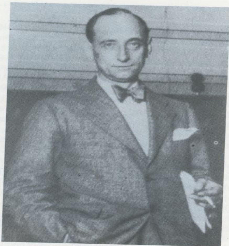
Casares Quiroga. Obtuvo la cartera de Gobernación tras los sucesos ocurridos en el sepelio del alférez De los Reyes. Pocos días después accedería a la jefatura del Gobierno.

eran los miembros del Ejército y Armada que pertenecieran a “organizaciones o asociaciones ilegales o contribuyan a su sostenimiento” y que tomaran parte en actos en los “que resulte perturbación de orden público o se dirijan a perturbarlo”, y los que favorecieran propagandas “o manejos contrarios al régimen republicano”.