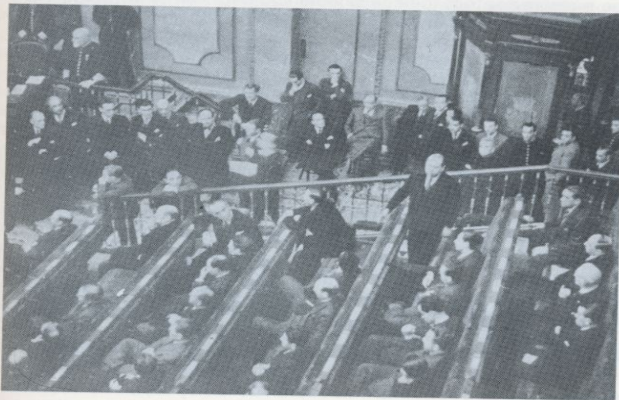
Gil Robles durante su intervención parlamentaria en el violento debate del día 15 de abril de 1936.

“Señor Azaña: No voy a reproducir uno por uno los argumentos expuestos por el señor Calvo Sotelo para describir la triste situación del orden público y la más triste situación del Gobierno frente a los desórdenes que se producen. Ya S.S. el día pasado decía, y de los grupos de la mayoría han salido interrupciones que corroboran esa tesis, que los desórdenes están promovidos por elementos perturbadores amparados o subvencionados por determinados grupos. ¿Lo cree así S.S.? Yo le rogaría que pusiera inmediatamente de manifiesto quiénes son esos agentes provocadores, quiénes les sostienen y quienes les amparan, porque, por lo que a mí respecta, desde este momento he de decir a S.S. que a mí y al partido que en estos momentos represento nos repugna de tal manera la violencia, que condenamos toda ella, venga de donde venga, y que creemos que algo más criminal que el matar es el dar dinero pa-