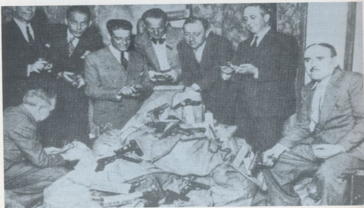
Pistolas encontradas en un cacheo a diputados de las Cortes del Frente Popular, una época en la que se creía necesario estar provisto de medios de defensa.

Indudablemente azaña preocupaba sobremanera el auge de la violencia, en torno al cual prosiguió hablando con un profundo conocimiento. Concluyó refiriéndose a la pobreza de las destruidas tierras españolas. Quería Azaña que una cosa se les pegase a los demás de él: su calma, que era también una fuerza política: “Cuando paso por algunas provincias de nuestro país, bellas desde la creación, miserables hoy, donde la pobreza española se ha comido hasta la corteza de los árboles y ya no queda nada por destruir, muchas veces me digo que nuestro país por esas muestras parece una tierra magnífica echada a perder por sus moradores... Ese mismo estrago de la tierra española lo observamos todos en el espíritu español, más difícil de restaurar que el estrago físico, y tanto como hablamos y hablan otros del abandonamiento de las riquezas españolas, que se pierden sin explotación, lo que yo más temo, lo que más me preocupa, a donde van a parar todos mis pensamientos,