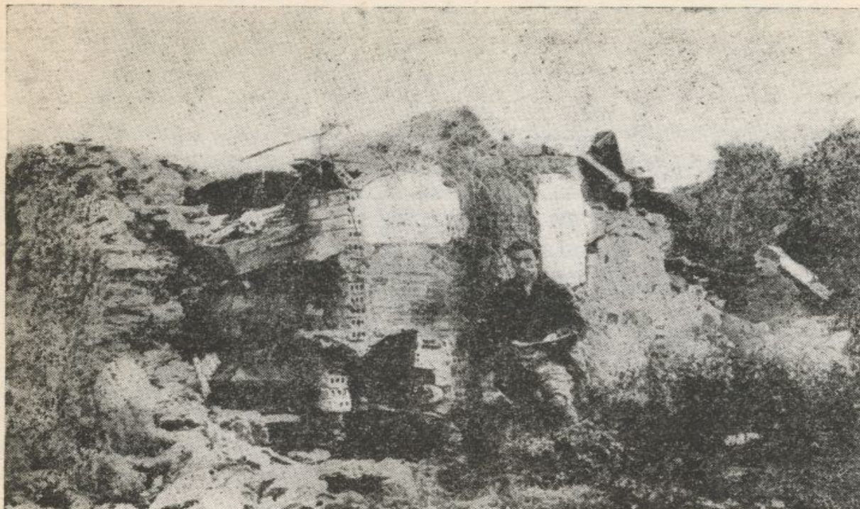
Familiarizados con la muerte, los defensores de Oviedo tuvieron sus líneas en contacto con los cementerios

El transcurso del tiempo no es suficiente para borrar las imágenes de quien, a diario, en el Puesto de mando, o en los Sectores del frente en los días de combate, nada distinguía el color de los uniformes de muertos y heridos que habían de evacuar las ambulancias o los vehículos improvisados para semejante tarea.