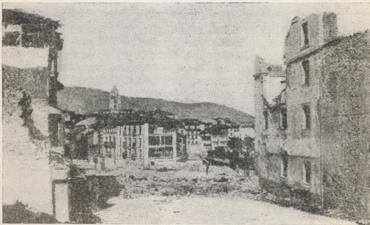
Ruinas de la ciudad de Oviedo. Al fondo, la catedral.

Y es también ahora cuando he podido medir hasta qué punto estas tropas que se llaman de Orden Público, como entonces también las de Asalto, actúan en la paz abnegadamente como garantía de su custodia, y son —como ahora la Policía Armada— la tranquilidad de los españoles, porque practican a diario sus tareas, que son algo más que la preparación para la guerra.