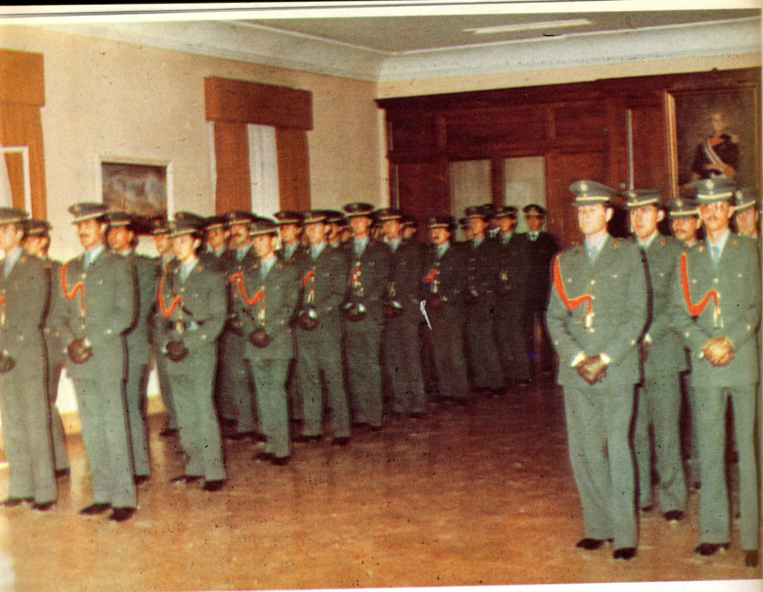
Formación en el salón de actos de la Academia

De acuerdo con ello, en el mencionado plan y entre los dos cursos se dedicaban al estudio del Derecho 353 horas, que, sobre las 1.600 teóricas, representaban un 22 por 100. Mas, ¿cuáles eran las materias? En el primer curso se intentaba conseguir un «baño» general al alumno a base del Derecho civil, administrativo, político, internacional, laboral e incluso canónico. Nos ha sorprendido grandemente esta última disciplina, pero su estudio lo hemos constatado con Jefes pertenecientes a las primeras promociones.