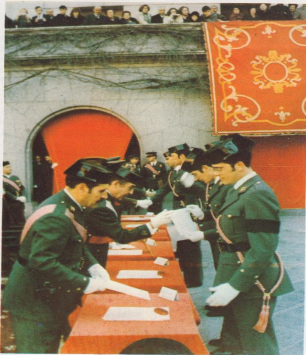
Entrega de despachos

Todo ello se completa con las clases prácticas dedicadas a la con-