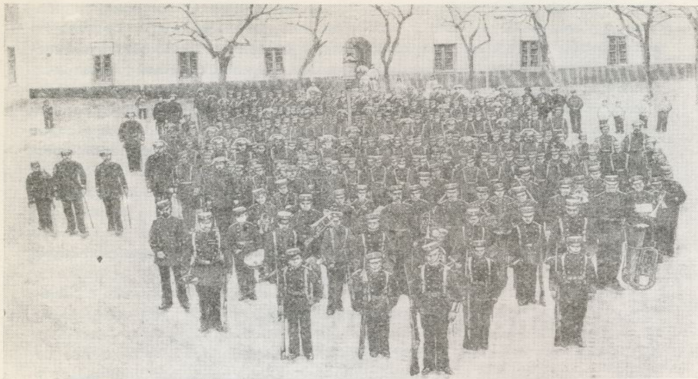
Colegio de Guardias Jóvenes de Valdemoro. Batallón de Infantería. Año 1892

en propiedad, en atención al estado satisfactorio con que desempeña su cometido».