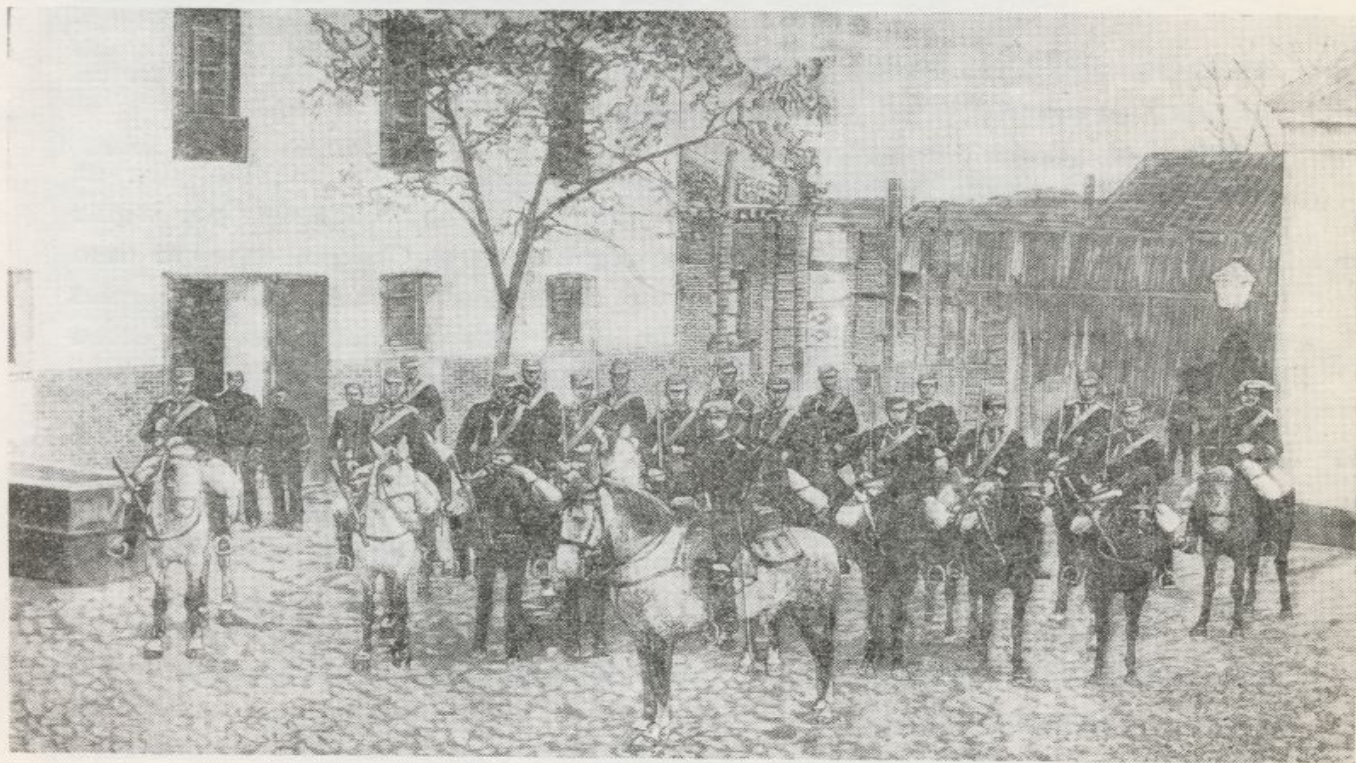
Colegio de Guardias Jóvenes de Valdemoro. Sección de Caballería. Año 1892

Al subalterno, segundo jefe de la Compañía, incumbían las obligaciones propias de su empleo y cargo, sustituyendo al Comandante en casos de ausencia o enfermedad del mismo. Al Sargento primero competía la responsabilidad de tener a su cargo el Repuesto de Vestuario, el armamento, menaje y utensilio, efectuar las compras de comestibles, formar las cuentas mensuales del gasto y, en suma, las inherentes a los suboficiales auxiliares de Compañías. Los Sargentos desempeñaban funciones propias de los actuales Jefes de Sección, y además se ocupaban de que los jóvenes «todas las noches, por Secciones reunidas, rezaran el Rosario», y de que en presencia de los Cabos respectivos repasasen los colegiados la lección de Doctrina cristiana que el maestro les hubiese señalado. Los Cabos tenían que dormir en el mismo dormitorio que su tropa, a cuyo efecto colocaban su cama a la cabecera de ella; cuida-