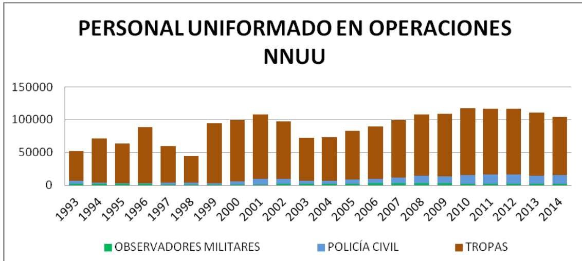
Ilustración 3 Personal uniformado en operaciones de Paz de las Naciones Unidas 1993-2014

Este análisis se ha realizado contabilizando los contingentes relativos a “tropas”, “observadores militares” y “policía civil”, resultando que, si bien el contingente de tropas supera en términos absolutos y claramente a los otros dos, el comportamiento del contingente de Observadores Militares se ha mantenido generalmente estable a lo largo del periodo. En cuanto al componente policial su importancia en términos relativos y en comparación con el resto de componentes uniformados ha ido ganando peso en la última década de forma continuada, con un descenso, si bien poco importante, en el año 2013, y una cierta recuperación el presente año. No obstante se puede restar importancia a esta reducción, ya que en ese mismo periodo se ha producido una reducción del resto del personal uniformado en las operaciones en marcha.