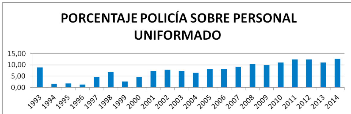
Ilustración 4 Porcentaje de personal policial sobre el total de personal uniformado en las operaciones de Paz de las Naciones Unidas 1993-2014

Este análisis se ha realizado contabilizando los contingentes relativos a “tropas”, “observadores militares” y “policía civil”, resultando que, si bien el contingente de tropas supera en términos absolutos y claramente a los otros dos, el comportamiento del contingente de Observadores Militares se ha mantenido generalmente estable a lo largo del periodo. En cuanto al componente policial su importancia en términos relativos y en comparación con el resto de componentes uniformados ha ido ganando peso en la última década de forma continuada, con un descenso, si bien poco importante, en el año 2013, y una cierta recuperación el presente año. No obstante se puede restar importancia a esta reducción, ya que en ese mismo periodo se ha producido una reducción del resto del personal uniformado en las operaciones en marcha.