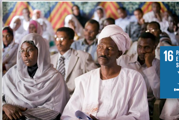
El comité de elecciones de Sudán realiza un taller para periodistas locales.

Así, el Objetivo 16 pretende frenar cualquier tipo de acto violento mediante la colaboración con los gobiernos y las comunidades. Para ello, es vital que exista un firme estado de derecho que respete, proteja y fomente los derechos humanos. Asimismo, la participación de los países en desarrollo en organizaciones internacionales es de suma importancia para lograr este objetivo.