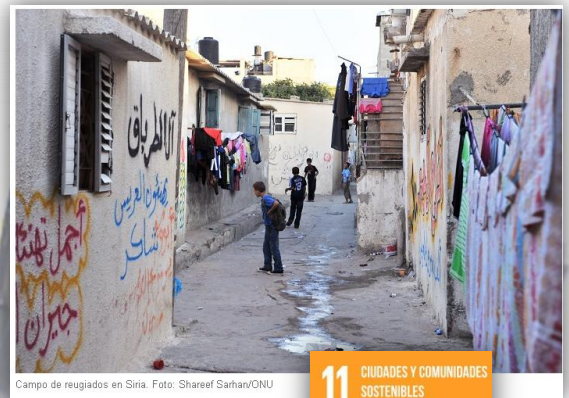
Campo de refugiados en Siria.

La pobreza extrema se suele concentrar en los espacios urbanos y tanto los gobiernos nacionales como los municipales luchan por absorber el aumento demográfico en estas zonas. Para mejorar la seguridad y sostenibilidad de las ciudades hay que garantizar la mejora de los asentamientos marginales y el acceso a viviendas seguras y asequibles.