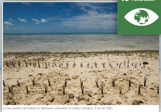
La isla pacífica de Kiribati es altamente vulnerable al cambio climático.