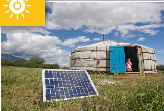
Una familia de Mongolia usa energía solar en su hogar.

Un objetivo crucial para estimular el crecimiento y ayudar al medio ambiente es el de expandir la infraestructura y mejorar la tecnología en los países en desarrollo.