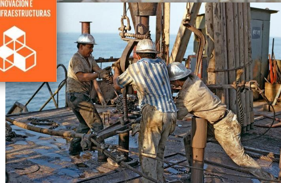
Extrayendo petróleo en Venezuela.