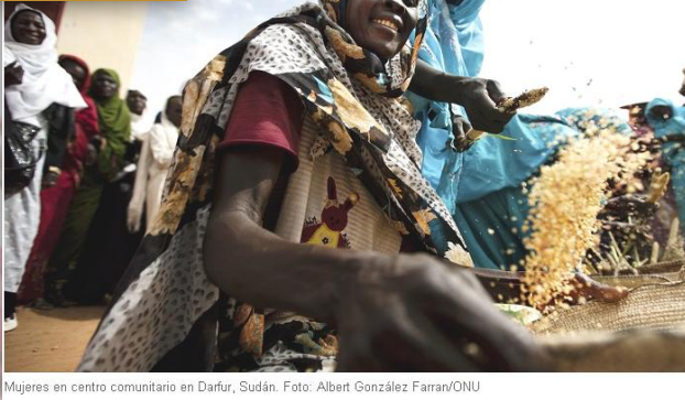
Mujeres en centro comunitario en Darfur, Sudán.

Para obtener un desarrollo sostenible y un crecimiento económico, es imprescindible reducir la huella ecológica. Esto se realiza mediante un cambio en los métodos de producción y consumo de bienes y recursos. Para lograr este objetivo, son vitales la forma en que se eliminan los desechos tóxicos y los contaminantes y la gestión eficiente de los recursos naturales compartidos.