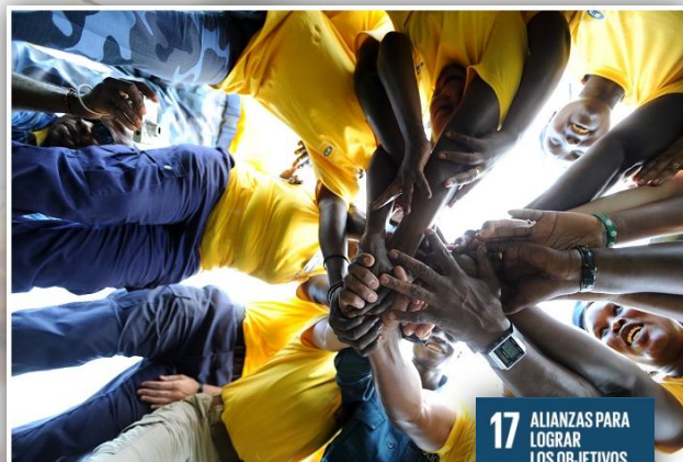
Día Internacional de la Paz celebrado en Sudán del Sur.

Para lograr todos estos objetivos, es necesaria la cooperación y la formación de alianzas globales. A pesar de que la ayuda humanitaria ha aumentado en los últimos años, los conflictos y desastres naturales hacen que sean necesarios más recursos y ayuda financiera, tanto para paliar estas crisis como para promocionar el desarrollo económico. Debemos aprovechar el fenómeno de la globalización para alcanzar el crecimiento y desarrollo sostenibles, coordinando las políticas con el fin de asistir a los países en desarrollo en el control de la deuda y promover inversiones para los menos desarrollados.