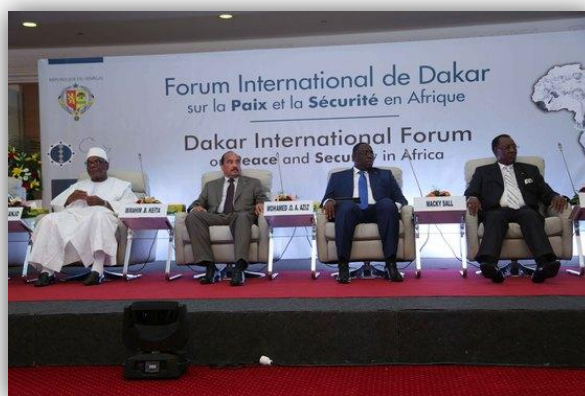
Keita (Malí), AbdelAziz (Mauritania), Sall (Senegal) y Déby (Chad) durante el Foro de Dakar.

“El terrorismo no tiene rostro ni conoce fronteras” , dijo en la clausura del Foro Internacional de Dakar sobre Paz y Seguridad 7 el presidente de Chad, Idris Déby, un país que en los últimos años se ha constituido una potencia militar emergente en la región centroafricana y del Sahel, “se alimenta de la pobreza y de interpretaciones erróneas de la religión. Tenemos que combatirlo con todo el vigor posible, lo que exige una fuerte movilización de recursos” , señaló.