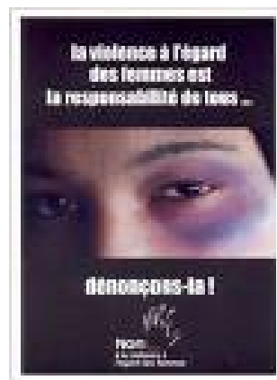
Figura 1. Cartel publicitario Francés

Es difícil obtener cifras sobre violencia doméstica. En España como se ha comentado más arriba gracias a la L.O. 1/2004, existe más conciencia sobre este tipo de sucesos y la mujer se ha hecho más valiente y llega a denunciar. Pero de todos es conocido el porcentaje de víctimas que no se atreven a ello, por lo que a las cifras oficiales hay que añadir las que no salen a la luz. Por ello las campañas publicitarias, no solamente en España sino en el resto de países Europeos, han ido encaminadas a animar a la víctima a que denuncie. (Figura 1).