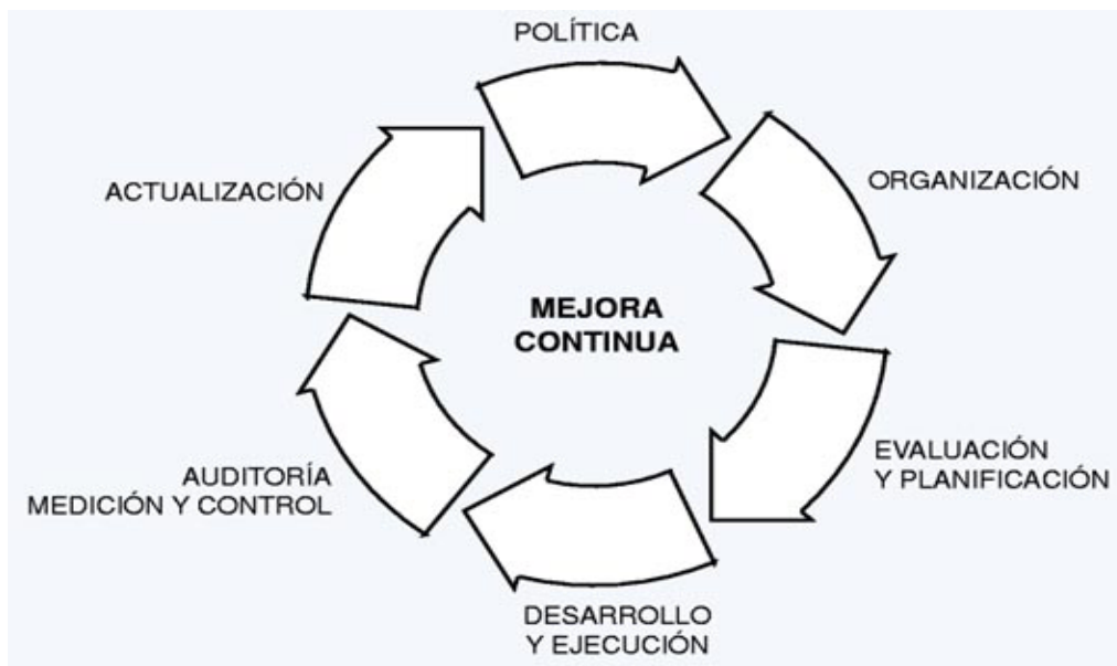
Figura 1.- La mejora continua, elemento esencial de los sistemas