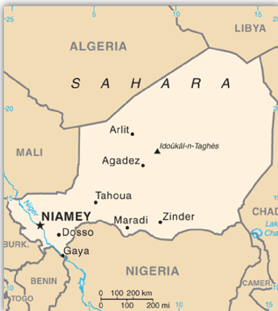
Figura 1 1